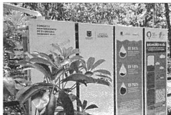
Figura 2. Ekomuro Edificio Bicentenario

En cuanto al mantenimiento de vehículos, desde la Dirección Administrativa de la entidad se realiza seguimiento correspondiente, por lo tanto, los servicios de lavado del parque automotor están respaldados por los respectivos certificados de vertimientos y planes de ahorro de agua, promoviendo el uso racional del agua y fortaleciendo el compromiso institucional con la sostenibilidad ambiental.