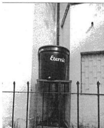
Figura 1. Sistema agua lluvia DGAEP